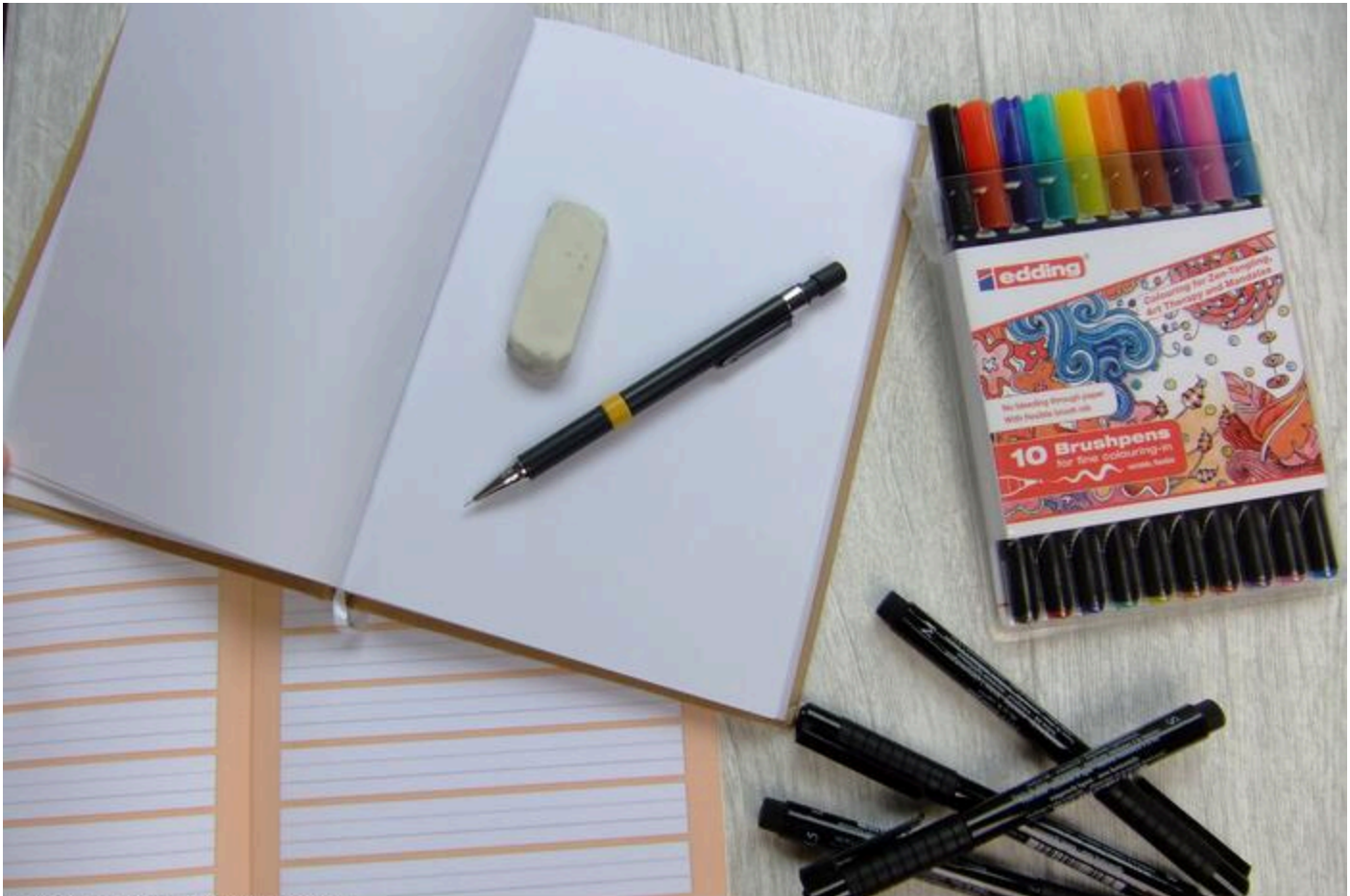
Hand Lettering - Erstausrüstung

Beim Brush Lettering benötigst du zusätzlich einen Brushpen. Unsere Empfehlung sind die Brushpens von edding . Sie haben qualitative Spitzen und fransen nicht aus. Nicht vergessen: Papierwahl ist wichtig! Beginne mit einem Schreiblernheft (Lineatur 1) und ein Pappmache-Notizbuch für Skizzen.