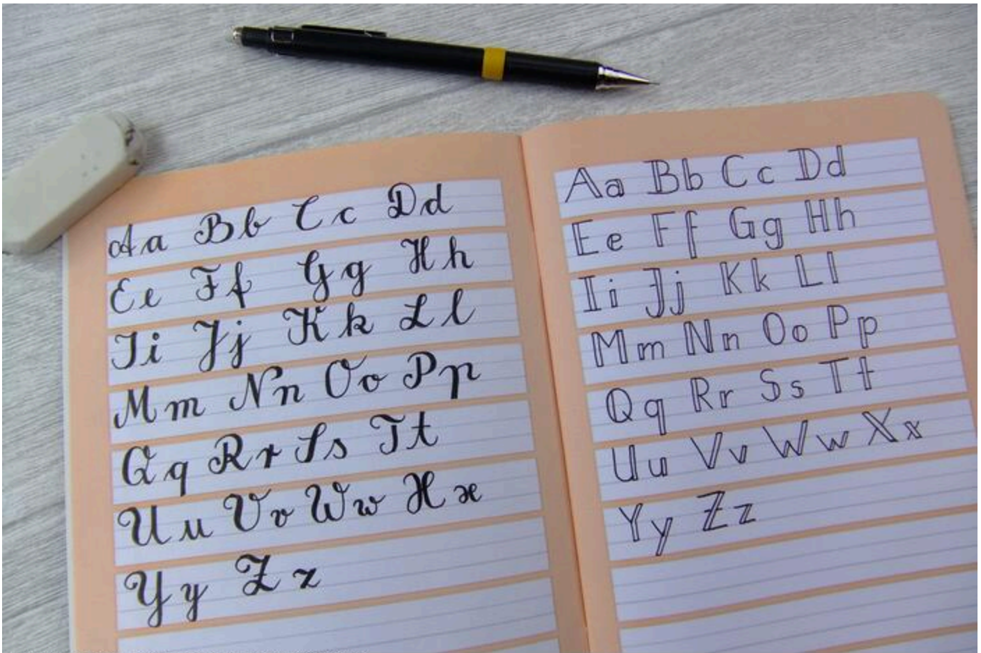
Hand Lettering - Schreibübungen Buchstaben

Eine Methode zum Sammeln von Schriftarten und Designideen ist das Notieren verschiedener Gestaltungen eines Wortes in deinem Notizbuch. Experimentiere mit verschiedenen Stiften. Bedenke: Übung macht den Meister!