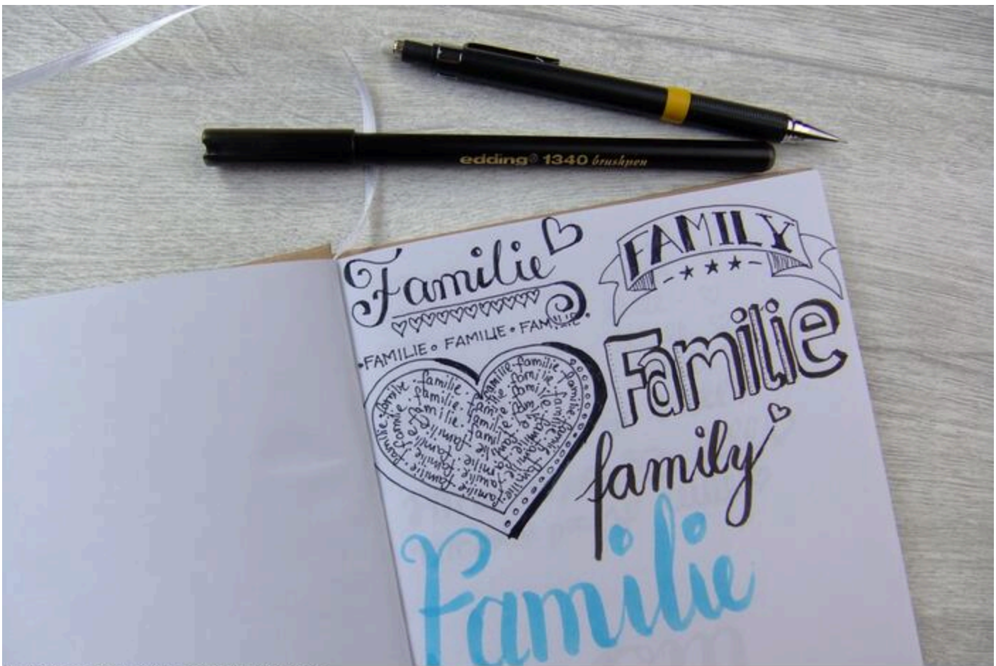
Hand Lettering - Schreibübungen Familie