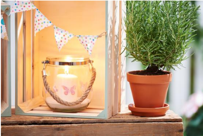
Windlicht mit Transfermotiv

Positioniere diese auf dem Windlicht und klebe sie mit Serviettenlack auf. Trage dabei so wenig wie möglich den Lack über das Motiv hinaus auf dem Glas auf. Überschüssigen Lack kannst du mit einem Bambusspieß wegkratzen oder mit Universalreiniger vorsichtig entfernen.