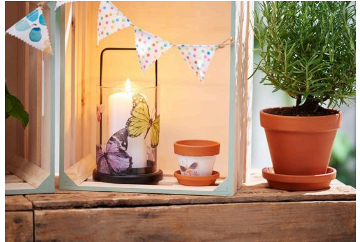
Serviettentechnik auf Glas