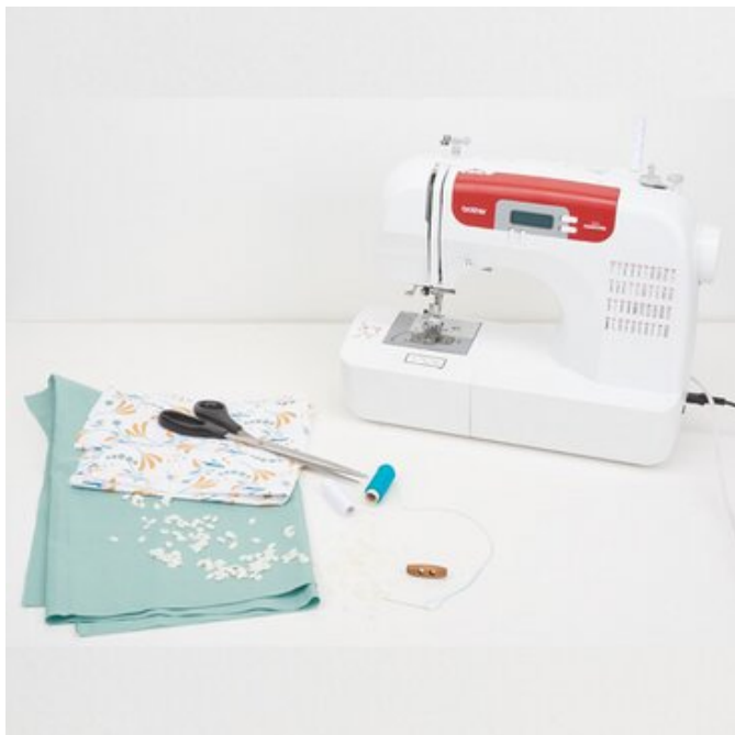
1. Material bereit legen