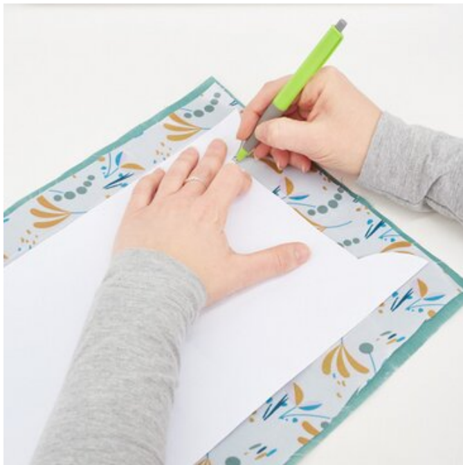
5. Stoff zuschneiden