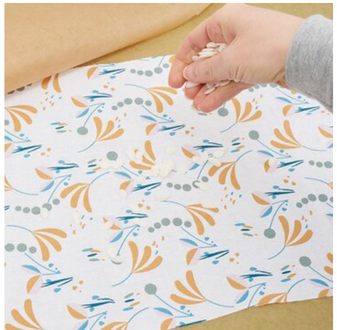
2. Mit Bienenwachs bestreuen