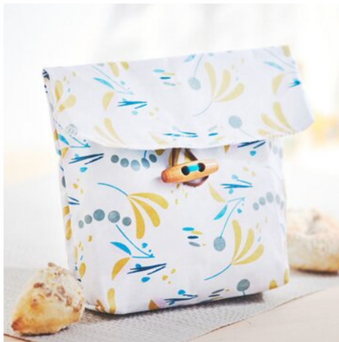
12. Knopf annähen