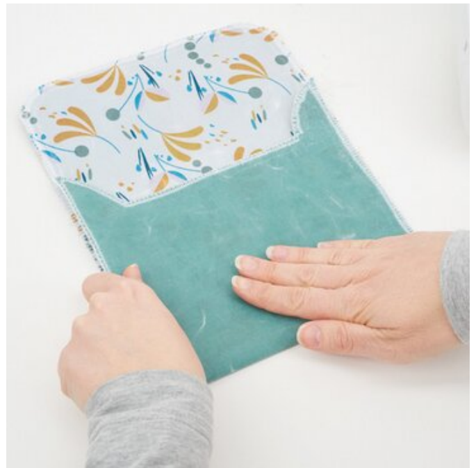
8. Tasche falten