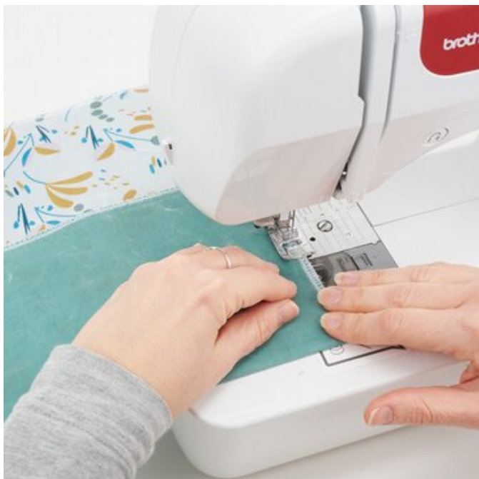
9. Taschenseiten nähen