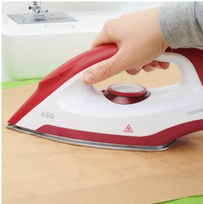
3. Wachs einbügeln