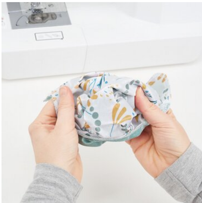
11. Tasche wenden