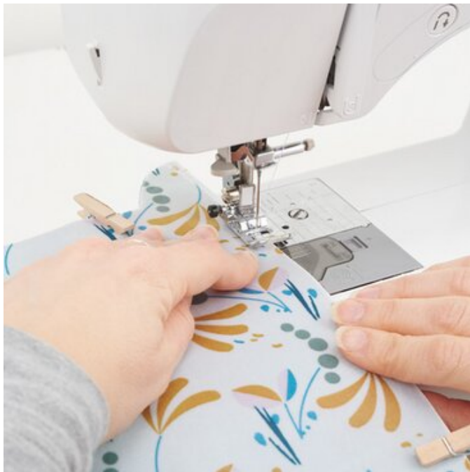
7. Zusammen nähen