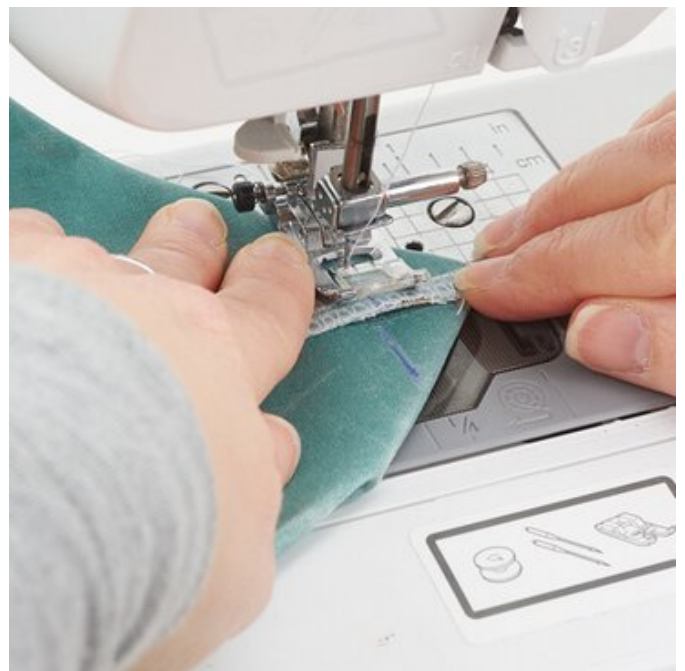
10. Taschenecken abnähen