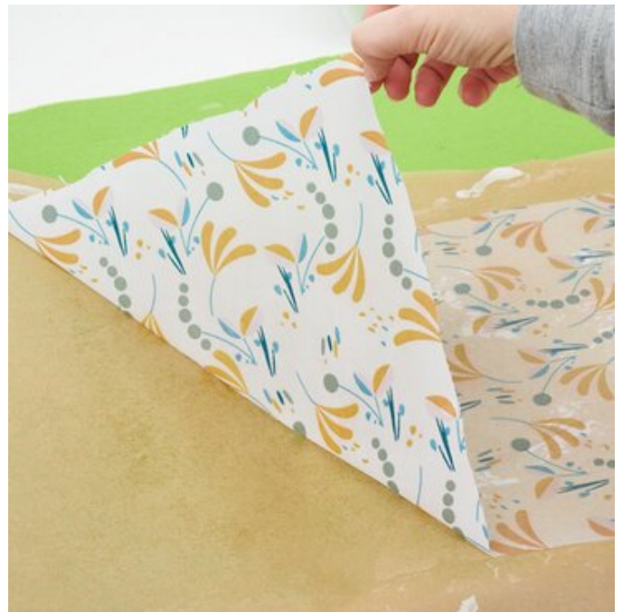
4. Stoffzuschnitt abziehen