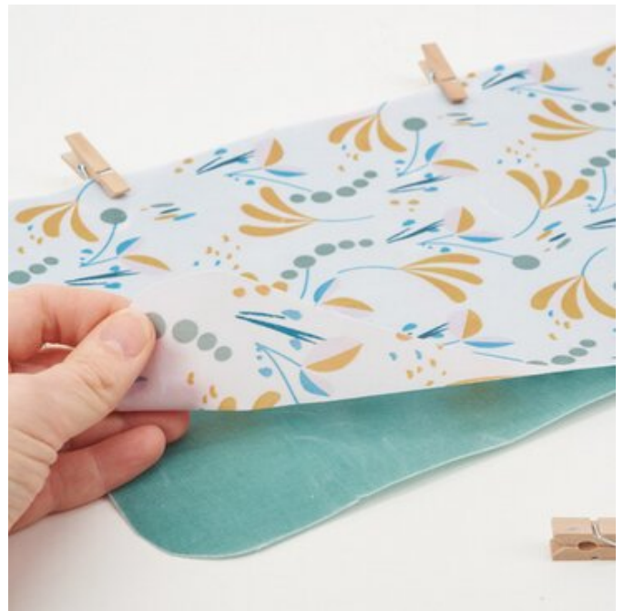
6. Zusammen heften