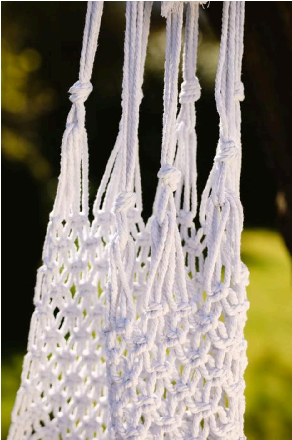
Aufhängekordeln am Makrameestück verknotet