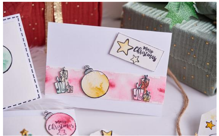
Tableau Easy Coloring

Créez un tableau de la même manière que les cartes de vœux.