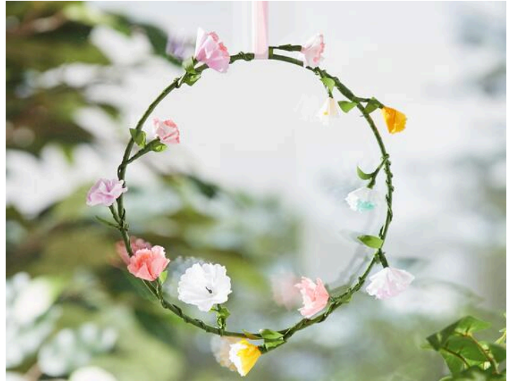
Couronne de fleurs de papier de soie