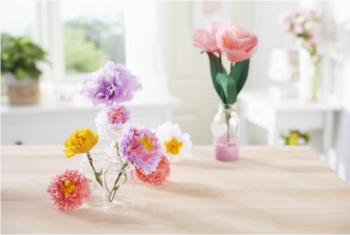
Fleurs de papier de soie