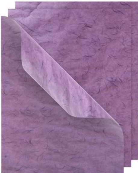
Soie de paille VBS, 50x70cm, 3 feuilles., Violet