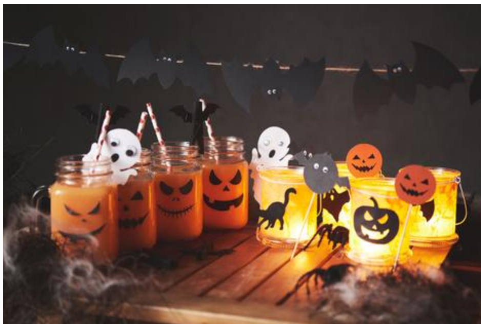
Une déco d'Halloween terrifiante