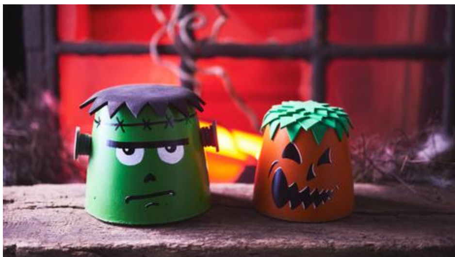
Cale-portes pour Halloween