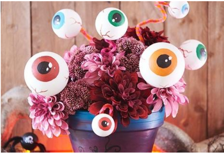
Des yeux en polystyrène terrifiants