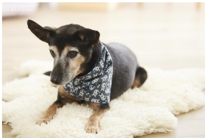
Foulard pour chien