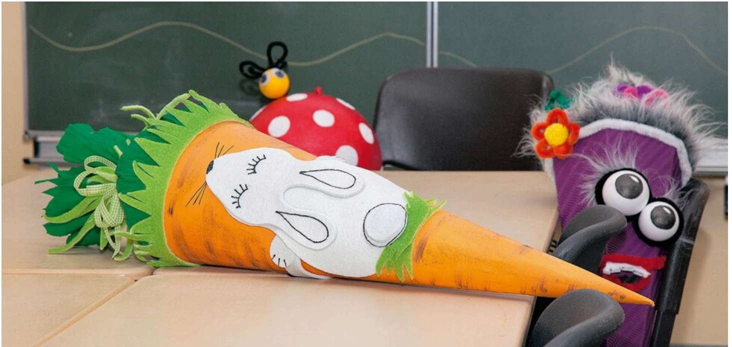
Schultüte zur Einschulung "Hase & Möhre"