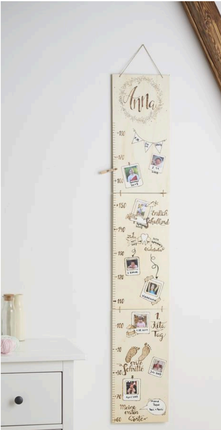
Klaar ontworpen is het een blikvanger: