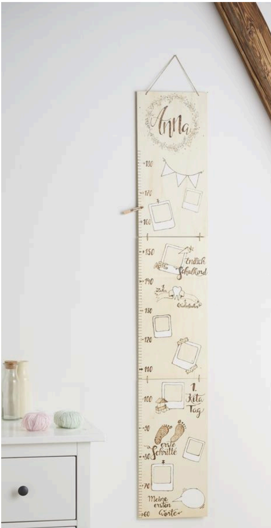
De maatstaf in de ruwe versie: