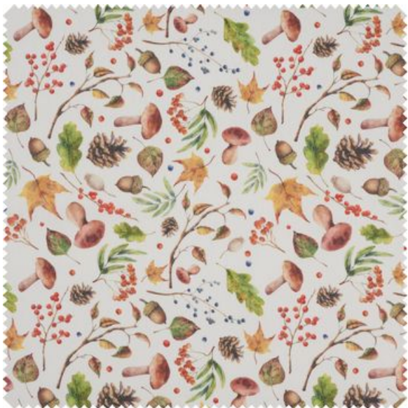
Motiefstof linnenlook "Herfstmagie"