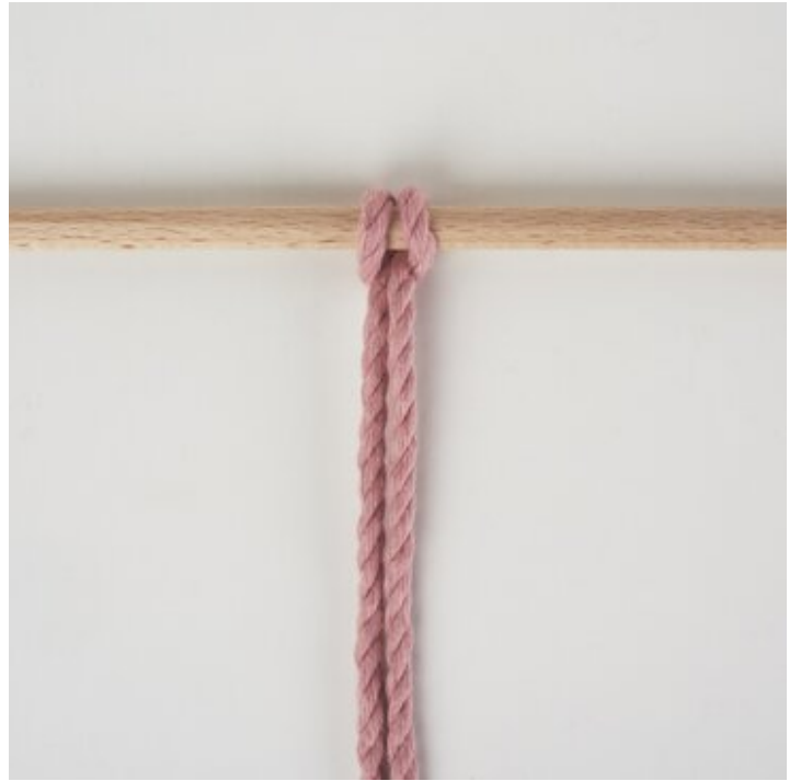
Lark's hoofd knoop achterover